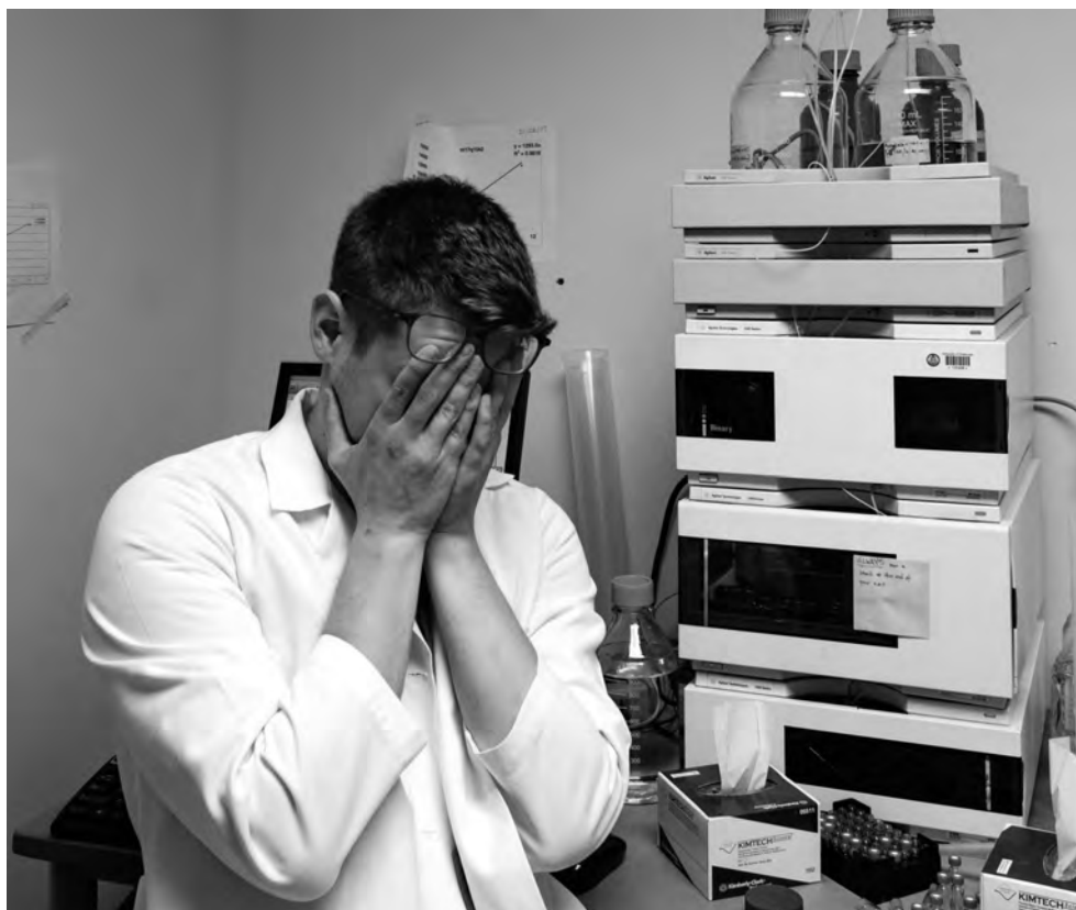
Gräfik: Foto: Kenny Drombosky / http://dromboskyk.myportfolio.com .

Ein großer Teil der Laborarbeit wird von unerfahrenen und überarbeiteten Studierenden, Doktorand_innen oder Postdocs durchgeführt. Sie sind oft darum bemüht, in einem möglichst kurzen Zeitraum die zur Arbeitshypothese passenden Ergebnisse zu erzielen, weil sich das positiv auf ihre Benotung oder erhoffte Vertragsverlängerung auswirkt.